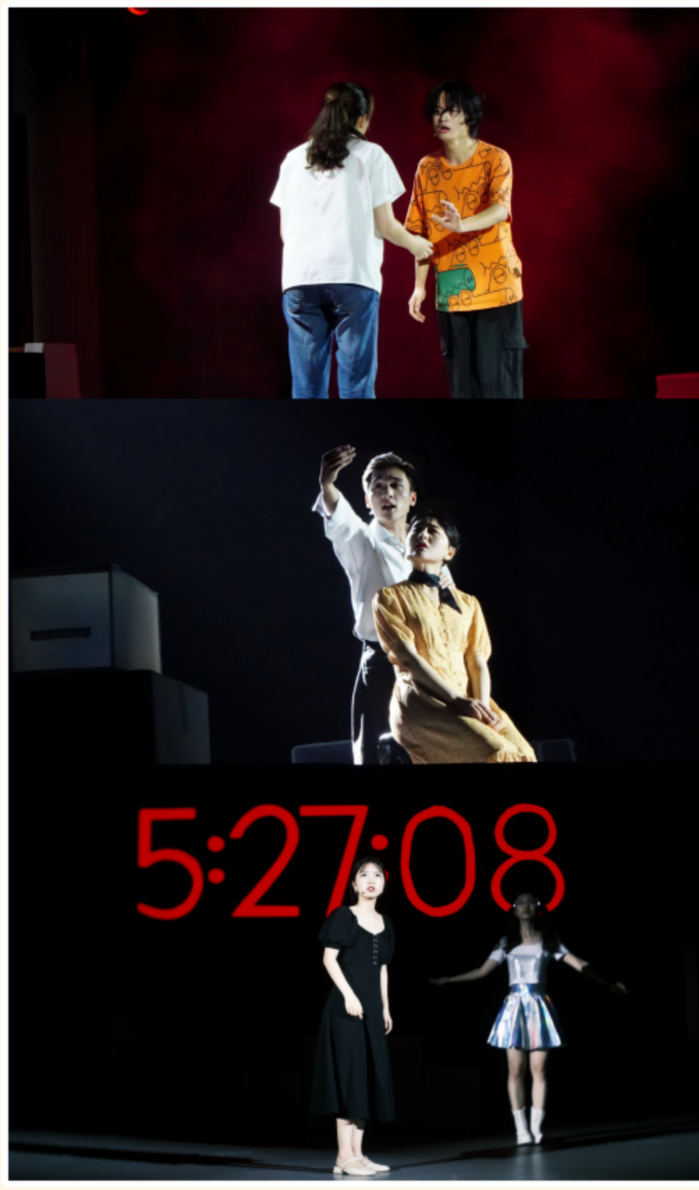
毕业大戏《相对关系》剧照

6月19日晚，2018级戏剧影视系毕业大戏《相对关系》在建南大会堂上演。《相对关系》由“我的狗呢？”“我的互联网爱人”“加密回忆”三幕构成，由2018级戏剧影视系本科生自编自导，并以此为核心，集结不同院系学生共同排演，通过别具一格的灯光、音乐、动画等多媒体表现形式，配合演员全情投入的演出，用戏剧的形式呈现出了一场友情、爱情、亲情的跨界“关系”相对论，演出掌声阵阵，收获观众一致好评。