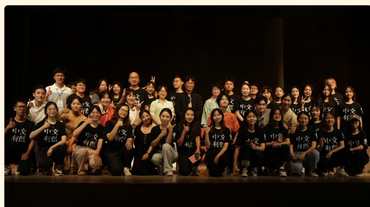
2018级戏剧影视系毕业大戏《相对关系》剧组

6月22日晚，南强话剧社原创话剧《我的醋香年代》于建南大会堂上演。该剧讲述了古镇上的一条老街——石头街上，几个家庭普通、境况迥异的小伙伴们成长、奋斗、挫败和老去的故事，在经过众多学生演职人员长达两个月的辛苦排练后，演出最终取得圆满成功，观众好评如潮。厦门大学电影学院党委副书记张晴、副院长李晓红，教授黄鸣奋、副教授王晓红、助理教授许映婷等到场观看演出。随着《我的醋香年代》演出的顺利结束，2022年第十三届中文有戏演出季也就此告一段落。