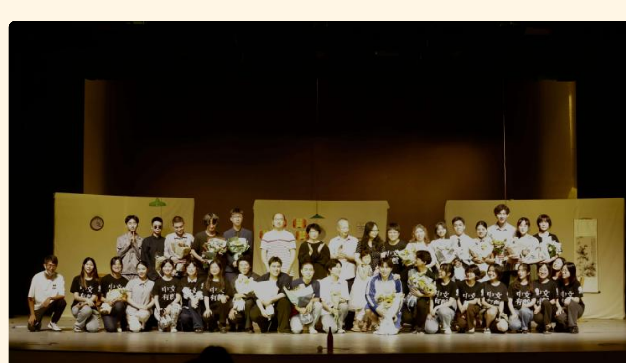
南强话剧社《我的醋香年代》剧组

在本次演出季中，来自不同院系的学生坚守着对戏剧的热爱和虔诚，精诚合作完成了台前幕后的各项工作，用汗水实现了青春和年华的献礼。“中文有戏”再出发，不仅致力于带给校内外观众更为精彩、多元的文艺作品，让厦门大学原创优秀校园文化活动更上一层楼，更希望借此吸引越来越多热爱艺术的人们投身艺术创作，为弘扬中华文化不遗余力，让中华文化在全世界一定“有戏”！